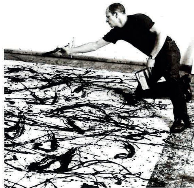
Dette fotografiet viser hvordan Pollock likte å male på store lerreter som lå flatt på gulvet.

Lenker til nettsider der du kan se flere bilder av Pollock og se en film av ham mens han arbeider, finner du på www.usborne-quicklinks.com