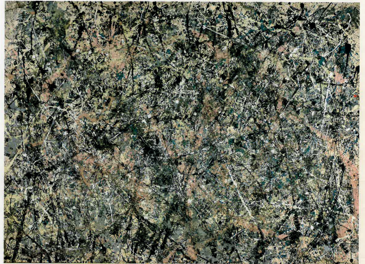
Pollock malte Lavendeltåke i 1950. Det måler hele 221 x 300 cm.